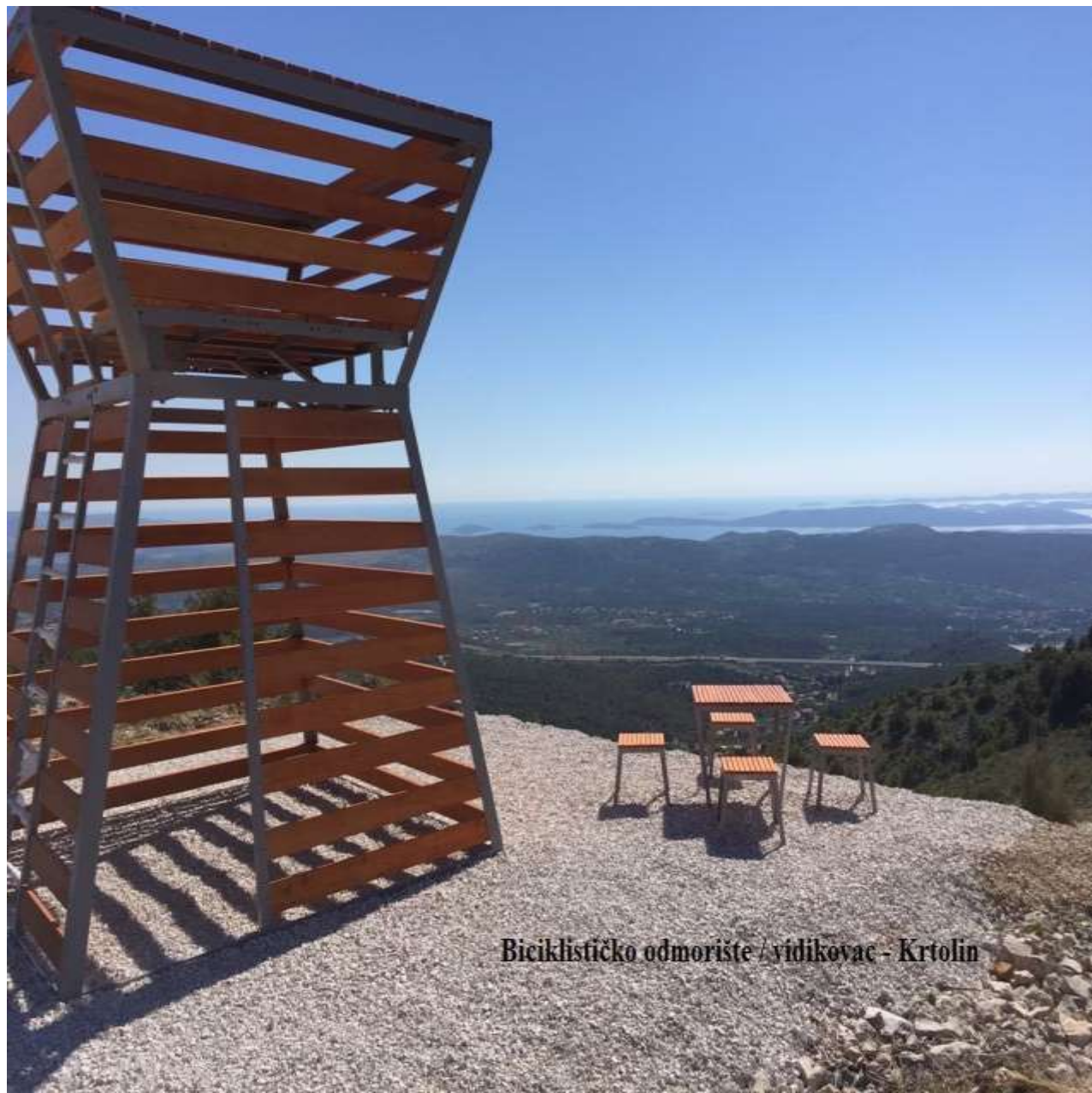
Biciklističko odmorište / vidikovac - Krtolin

➤ Postavljena 4 bike odmorišta na različitim lokacijama grada Šibenika