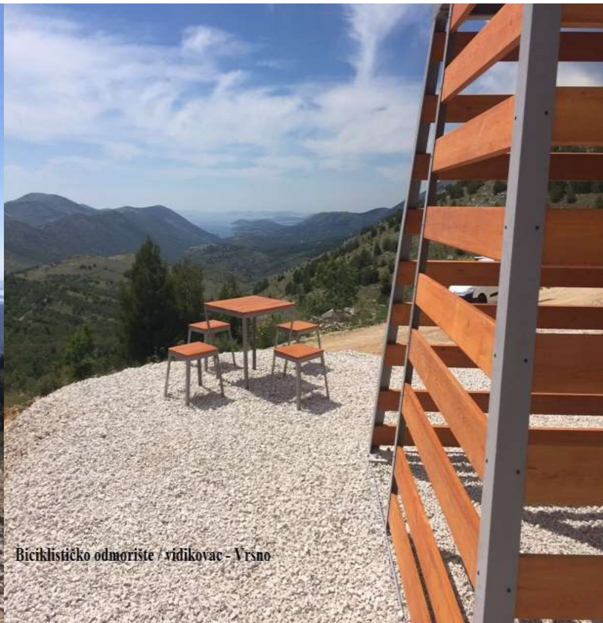
Biciklističko odmorište / vidikovac - Vrsno